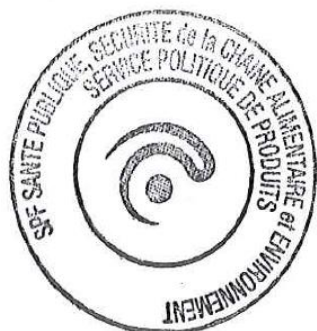
Hannelore Schorpion "Point Focal EU Ecolabel" Organisme Compétent belge